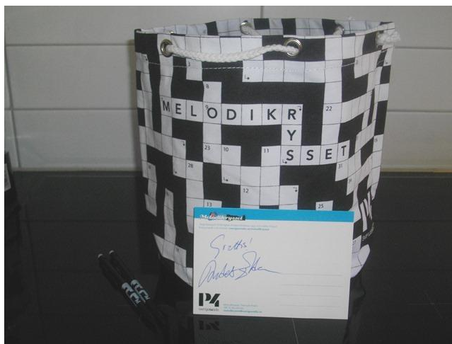
Melodikryssets brödkorg i Rydebäck

Bara nu Toje inte lämnar orienteringen till förmån för Melodikrysset. Det skulle vara en förlust för orienteringssporten!