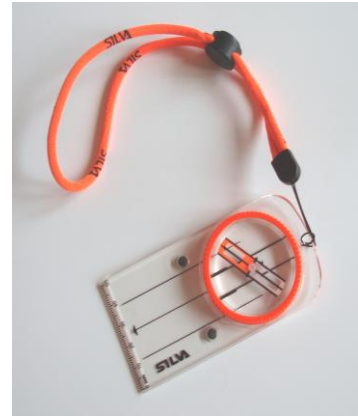
Silva Race Plate

Linjalkompassen Silva Race Plate som jag fick i ersättning för min havererade Silva 5 Jet har jag nu testat i några träningslöp. Vad tycker jag då . . . . . Nja . . . . . Om vi börjar med ”formatet” så tycker jag den passar bättre i handen på ungdomar tävlande i klasserna DH10 eller DH12. I en ”veteranhand” känns den liten! Att ta ut kompassriktningen från en punkt till en annan går väl an med torra och rena händer. Men med blöta händer en regnig natt känns det inte alls bra. Man får samma ”fingertoppskänsla” som när man öppnar en förpackning mjölk eller ProViva med skruvlock. Känslan av billigt plastiskt material finns där. Det går inte alls att jämföra med Silva 5 Jets robusta kompasshusdesign.