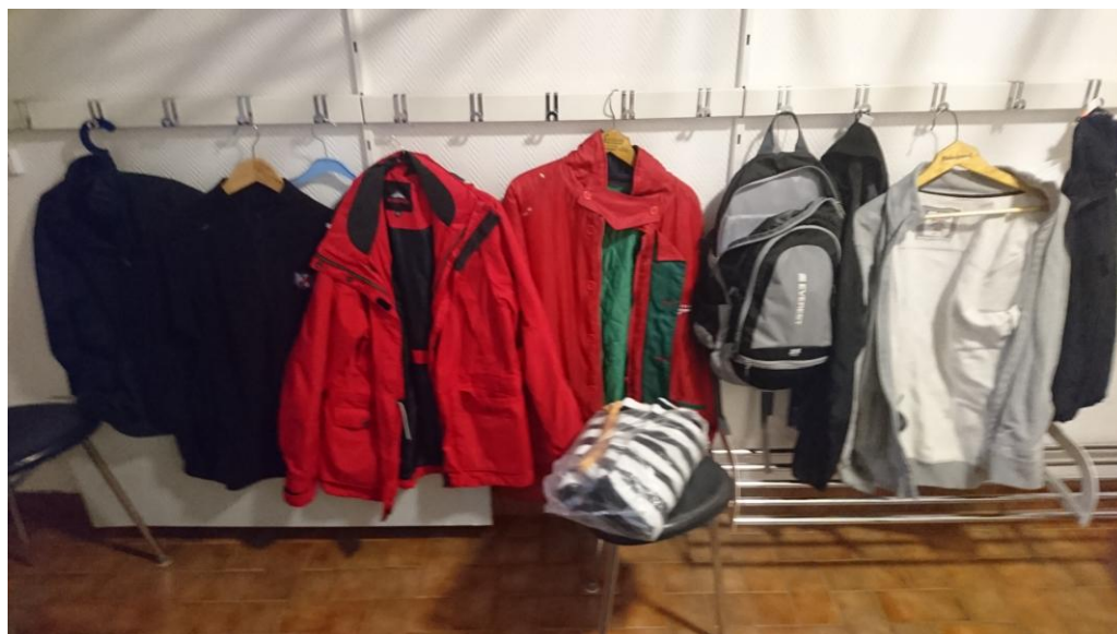
Kapprummet i klubbstugan

Plagg som ej är avhämtade, senast den 31 december, kommer att skänkas till en välgörenhetsorganisation.