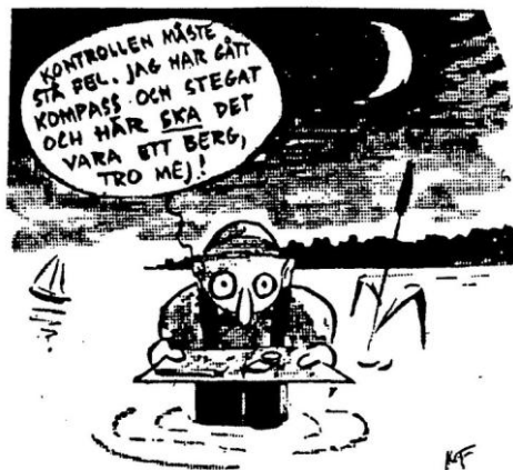
Teckning Martin Frohm

Torsdagen den 10 november arrangeras KM i nattorientering i Pålsjö. Löpare från Hjärnarps OL, Rävetofta OK samt NV-Skånes Veteraner, d.v.s. ”Stamgästerna”, är inbjudna att delta i detta arrangemang men de tävlar naturligtvis ej om HSOK:s mästerskapsmedaljer. Anmälan via Eventor, där även PM finns, senast måndagen den 7 november kl 20.