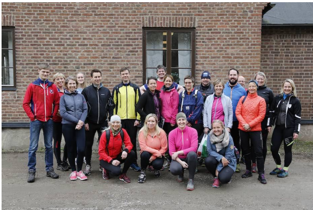
Kursdeltagare med lärare.