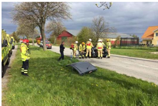
Bild till vänster: Från den 7 maj 2017. Personal från räddningstjänsten i Trelleborg i arbete vid Runes bil. Notera det avklippta taket i förgrunden.